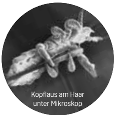
Kopflaus am Haar unter Mikroskop