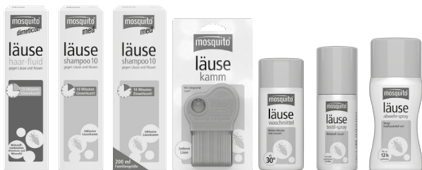
Läuse-Haar-Fluid 100 ml PZN 11092620

Restentleerte Behälter der Wertoffsammlung zuführen.