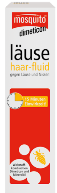
Fluide cheveux anti-poux 100 ml PZN 11092620

La quantité nécessaire dépend essentiellement de la longueur et du volume des cheveux. Répartir le fluide sur cheveux secs et veiller à ce que toute la chevelure soit entièrement imbibée de fluide, y compris toute la longueur. Il est de même nécessaire de traiter tout le cuir chevelu. Veiller en particulier à ce que les parties derrière les oreilles, la nuque et les tempes soient suffisamment humectées de fluide cheveux anti-poux mosquito® à base de diméticone. Le fluide cheveux anti-poux mosquito® à base de diméticone ne peut agir