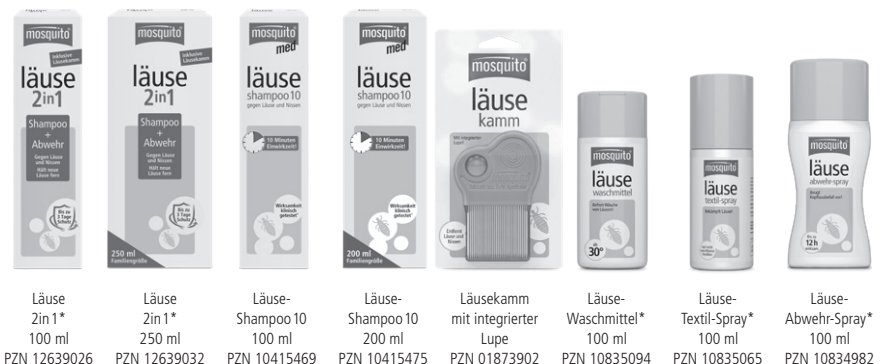
Läuse 2in1* 100 ml PZN 12639026 Läuse 2in1* 250 ml PZN 12639032 Läuse-Shampoo 10 100 ml PZN 10415469 Läuse-Shampoo 10 200 ml PZN 10415475 Läusekamm mit integrierter Lupe PZN 01873902 Läuse-Waschmittel* 100 ml PZN 10835094 Läuse-Textil-Spray* 100 ml PZN 10835065 Läuse-Abwehr-Spray* 100 ml PZN 10834982