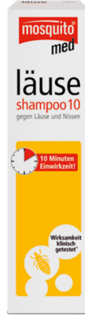
Bit Şampuanı 10 (Läuse-Shampoo 10) 100 ml PZN 10415469