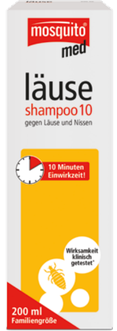
Bit Şampuanı 10 (Läuse-Shampoo 10) 200 ml PZN 10415475

Bilgilerin son güncelleme tarihi: Nisan 2015